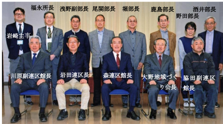
令和3年度浅井公民館役員