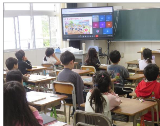
【オンラインでの話を聞いている様子】

学校は「社会の縮図」でもあります。地域社会のルールが皆の安全を守るように、子ども達にも学校という自分たちの社会の中で、ルールを意識した生活を送り、相手を思いやる優しい心を育んで欲しいと願っています。子ども達が安心して充実した学校生活を送ることができるよう、教職員一同、一丸となって指導にあたっています。