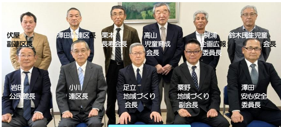
令和8年度 役員の皆さん

第二部では各専門委員会に分かれて、活動内容の協議とホームページ担当者の選出を行いました。