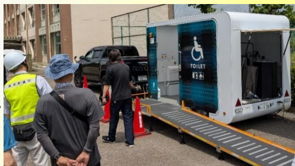
【昨年の浅井中小学校でのモバイルトイレ展示】

電動車椅子が通れる緩やかなスロープや、オストメイトにも配慮したユニバーサルデザインの便座、介助が必要な大人が横になれる大型の多目的シートを備えています。また、バリアフリー設計でありながら、普通免許でけん引できる高い機動性を持ち、断水や停電した地域の避難所等において活用が可能です。