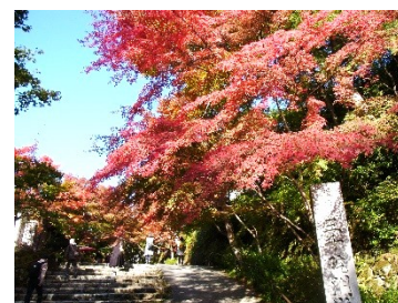
紅葉の大原三千院

11月7日(月)絶好の秋晴れの下、シルバー教養講座の社会見学が開催されました。総勢44名の参加者がバス2台に分乗し、京都の平安神宮、昼食後大原三千院を見学しました。帰りのバス内では今年度の講座の閉講式と皆勤賞の表彰が行われました。