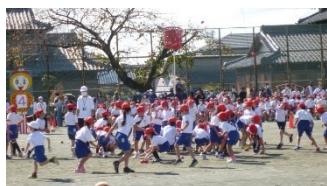
南小の玉入れと綱引き

10月22日(土)に浅井北小学校、29日(土)に浅井南小学校で運動会が開催されました。浅井北小学校では全児童が校庭に集まり、開会式後2学年ずつ「表現」と「徒競走」を行いました。今年も午前中だけの演技で、楽しみなお昼ご飯は食べられませんでした。児童や保護者の入れ替えは行われなくなり、少しだけ明るい兆しが見えてきました。浅井南小学校は学年ごとの徒競走から始まり、給水タイムの後2学年ごとの表現が披露されました。休憩後、赤組・白組に分かれ1・2年生は「玉入れ」を3・4年生と5・6年生は「綱引き」を行いました。