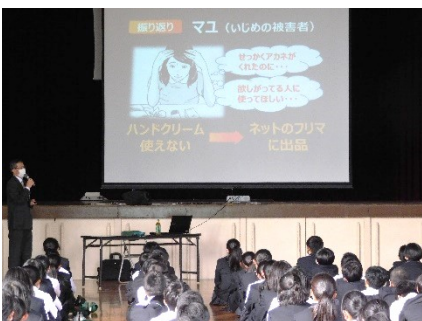
トラブル事例の振り返り

そこで本校では、道徳科においてネットトラブルを題材にした授業を行ったり、毎年、専門家の方を講師としてお招きして「スマホ・ケータイ安全教室」を開催したりして指導を進めています。今年度は、10月25日に1・2年生を対象に「スマホ・ケータイ安全教室」を開催しました。その中では、実際に起こりそうなトラブルをアニメで視聴した後、誰のどこが間違った行為だったのかを、生徒たちが話し合っ