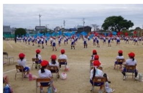
北小の表現と徒競走