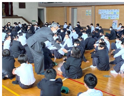
トラブル事例についての意見発表

そこで大切となるのが「ネットリテラシー」です。これは、「インターネットリテラシー」の略で、インターネットを使うために必要な知識やスキルのことです。ネットリテラシーが低いと、SNSでトラブルになったり、ネット詐欺などの犯罪に巻き込まれてしまったりする可能性が高くなります。