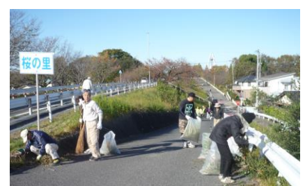
桜の里付近の堤防清掃