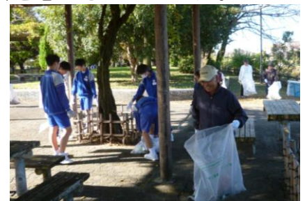
浅井山公園内の清掃

11月10日(日)午前9時から「ピカピカ大作戦」が浅井町連区全域で開催されました。大人から子どもまで総勢3,200人ほどの町民が、普段利用している公園、道路などを中心に清掃ボランティア活動に参加し、気持ち良い汗をかきました。