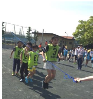
子ども会対抗大縄跳び