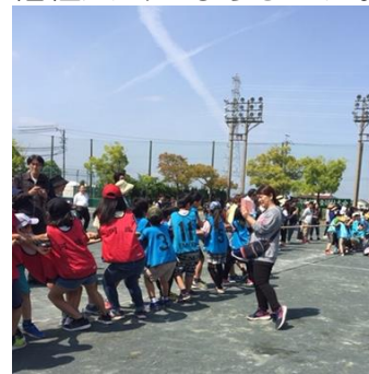
学校対抗の綱引き