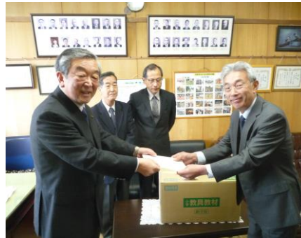
浅井北小樋口校長へ