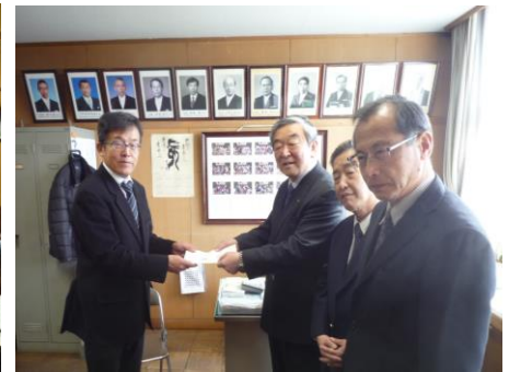
浅井中小図師校長へ